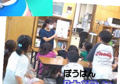
ぼうはん ~防犯クイズ~