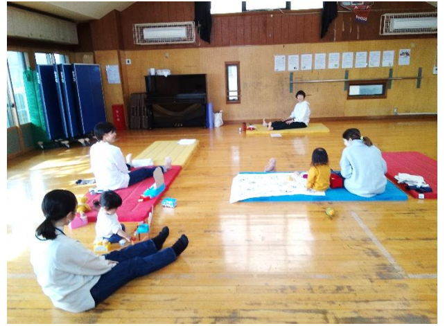
1月の親子ヨガではみんなで体を伸ばして、 気持ちもリフレッシュできました