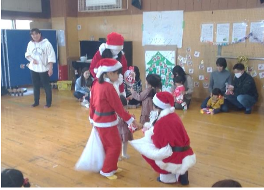
12月の乳幼児クリスマス会の様子