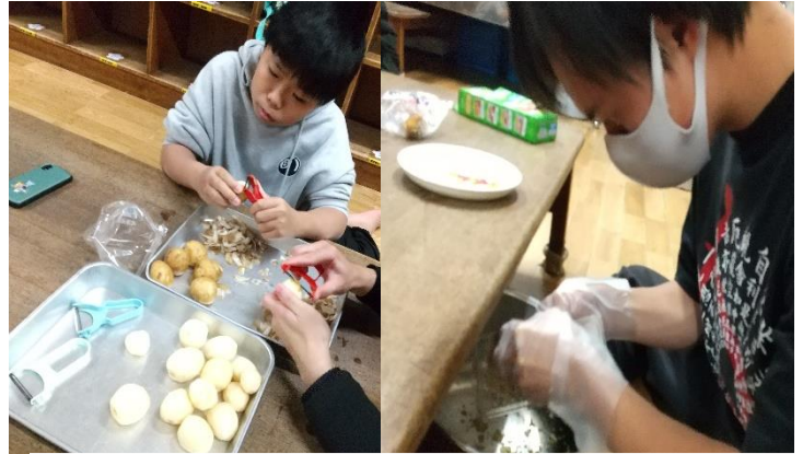
中高生クッキングでは皆で手分けをして作っています