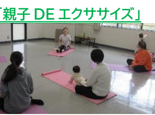
「久しぶりに体を動かせて、すっきりしました！」