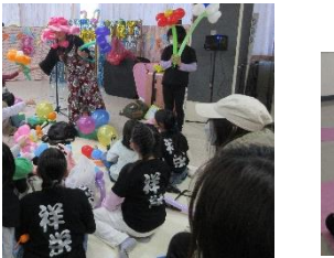
「バルーンショーも楽しかったです！」