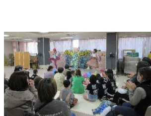
「コンサート、楽しかったです！」