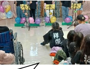
子ども達による「ハンドベル」