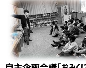
自主企画会議「おみくじ遊び」