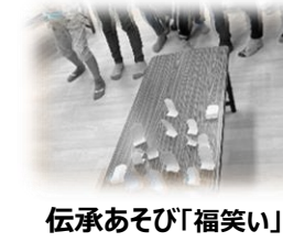
伝承あそび「福笑い」