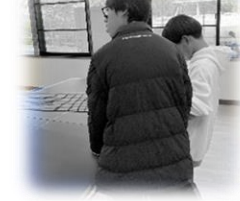
安全の日「洪水・水害」