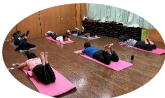
母親クラブママヨガ