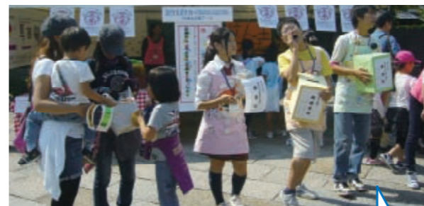
中高生が「東日本大震災応援プロジェクトコーナー」を担当しました。募金にご協力、ありがとうございました。

今年度も「やんちゃフェスタ」が10月8日(土)、梅小路公園にて開催されました。今年は、東日本大震災の被災地へ「笑顔の輪をひろげよう」との思いを込めて、支援ブース・コーナーを設けました。また、その他にもライブトゥギャザー(ステージ発表)、遊びや工作コーナー、乳幼児向けコーナーをはじめ盛りだくさんの内容となり、子どもたちだけでなく大人の方にも笑顔が溢れるお祭りになりました。