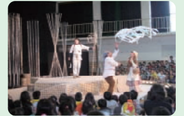
5/21 醍醐西小学校 1,000人

午後は、「世界の遊び」をテーマにコーナーを展開。参加した子どもたちは、パスポートを手に「あそびトラベラー」となり、11の国や地域を旅してその場所にちなんだ遊びや工作を楽しみ、ちょっとした世界旅行の気分を味わいました。