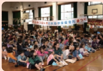
5/28 楽只小学校体育館 550人

「アメリカな工作 YES WE 缶」「チャレンジ！ヨーロッパ！たのしいゲームがいっぱい！いくつクリアできるかな!?!」「きて！みて！あそんで！アジア遊び・アジアな遊びを体験しよう!」「動物パラダイス・ぐるっとジャングルをひとまわり！アフリカ動物とあそぼう!」等のコーナーや、4人の海賊と対決できるコーナーがあり、雨にもかかわらず子どもたちは楽しく、和気あいあいとした一日をすごしました。