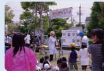
5/21 右京ふれあい文化会館および太秦安井公園芝生広場 2,000人

会館内では子どもたちのステージ発表・ジャグリングショー、乳幼児コーナーが展開されました。公園では、「ふしぎ」をテーマにした5つのコーナーや起震車体験・ミニパトカー展示・フェイスペイント等もあり、子どもたちの歓声が絶えませんでした。中・高生によるジュース販売も行われるなど、たくさんの親子で終日にぎわった児童館まつりとなりました。