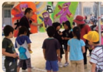
5/21 吉祥院小学校 1,000人

さわやかな好天に恵まれ、たくさんの来場者が忍者の世界を楽しみました。午前中はアイテムを作ったり、修業をしたり、対戦したり好きなコーナーで遊びました。乳幼児コーナーや東日本大震災応援コーナーも好評でした。午後からの「伊賀流忍者集団『黒党（くろんど）』による忍者ショーでは、数人の子どもが舞台上に上がって参加したり、楽しいひとときを過ごしました。