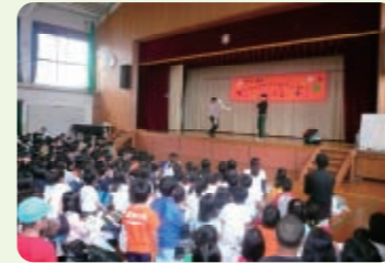
5/28 養正小学校 900人

あいにくのお天気で企画を変更し、主に体育館での開催となりました。ステージでは子どもたちの元気いっぱいの開幕太鼓、歌やダンス、遊びの発表や、大学生のジャグリングショーを楽しみました。また乳幼児コーナーでは、親子で電車ごっこを楽しみました。歓声のあがる中、笑顔いっぱいのまつりとなりました。