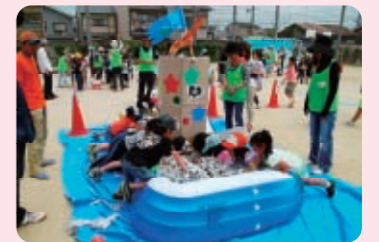
5/21 伏見南浜小学校 1,200人

晴天に恵まれ、多くの来場者がありました。午前は劇団「むむのこ」による光る影絵やパネルシアター公演を楽しみました。午後からは、「わいわいあそぼうげんキッズ」～ちびっこ海賊大集合!!～をキャッチフレーズに会場全体を海賊のテーマで統一し、子どもたちは楽しそうに各コーナーをまわっていました。当日は同志社大学の学生によるダブルタッチや、模擬店でのパン販売もあり、賑やかなおまつりになりました。