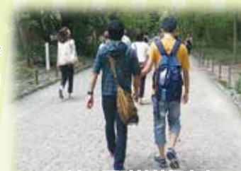
ただ今、下鴨神社探索中!