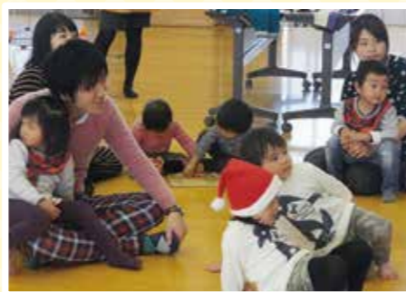
お父さんも一緒に、ほっこり...