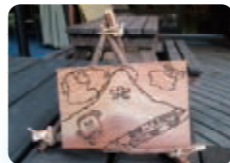
下京ひかり児童館 学童クラブ児童 3年生 クラブ 「写真たて&ウッドバーニング」 初体験の電熱ペン、難しかったけど 素敵な作品に仕上がりました。