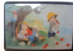
京都市室町児童館 学童クラブ 共同作品 パズル「うめ吉」 外国に帰る友達との思い出に 20人で1ヵ月かけてつくりました。

児童館・学童クラブ関係者や子どもたちによる投票の結果、デザインと名前が決定いたしました！マスコットの名前は「きらきら キッズちゃん」です!! 皆さんからご提案いただいた「キッズちゃん」「キラキラちゃん」「きらきらレインボーちゃん」などの中から、「笑顔と元気 きらきらと輝く子ども（キッズ）たち」との意味を込めて、名付けさせていただきました。やんちゃフェスタ2013（第1部）でお披露目の予定ですので、おたのしみに♪