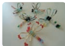
京都市東和学童保育所 学童クラブ児童 1年生 ビーズの作品「赤とんぼ」 お父さんに見せたら「絵具をこぼした みたいいな赤とんぼ」だって。