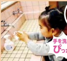
手洗い・うがいをして下さい。 消毒もしましょう。