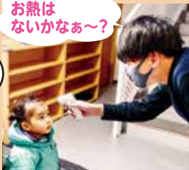
職員が、検温をします。