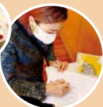
保護者の方には、来館者 名簿・健康観察表の記入 をお願いしています。