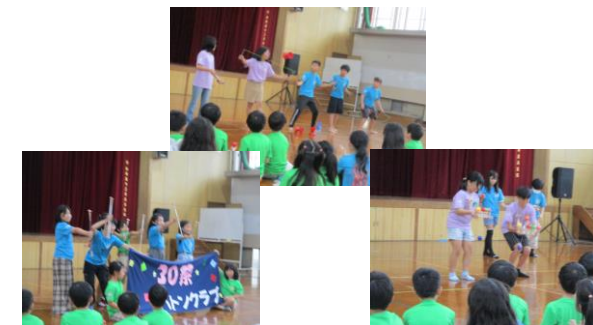
吉祥院ふれあいジャンボリー