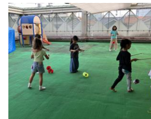
いっしょにあそぼう (ディアポロ)