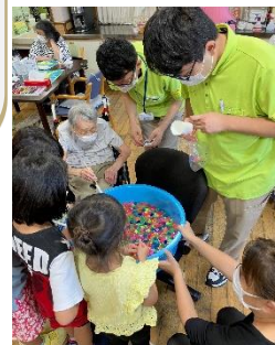
吉祥院老人デイサービスセンターとの交流