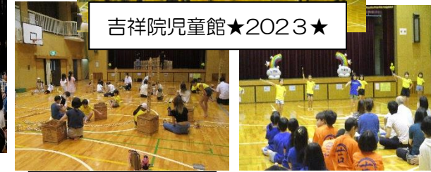
1万ピースのカブラであそぼう