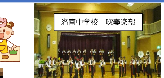
洛南中学校 吹奏楽部