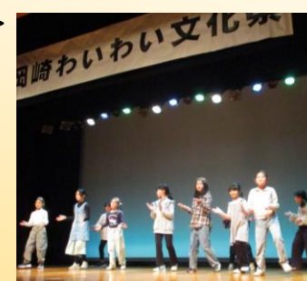
4グループに分かれて発表しました。

今年もダンスクラブ36名で出演させていただきました。新メンバーにとっては初めての発表の場ということもありとても緊張している様子でした。入部5、6年目の先輩メンバーがしっかりフォローしてくれていました! 他の出演団体さんの発表も観覧させていただき、改めて岡崎学区の皆さまのパワーを感じる1日でした。