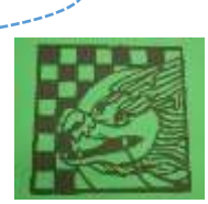
(3年生以上・土曜) きりえクラブ