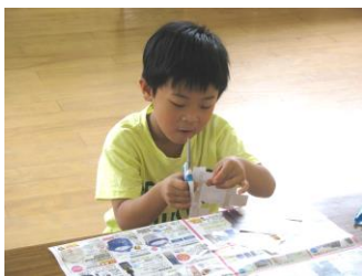
★ペーパーアートクラブ★