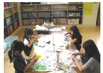
★ハンドメイドクラブ★