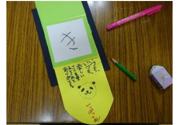
手作りクラブ作品